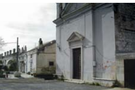
Borgo di Montaltino