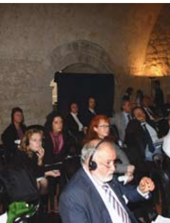
L'affluenza di pubblico agli incontri AISLo di ottobre 2005

Giovedì 27: 231 presenti Venerdì 28: 376 presenti Sabato 29: 160 presenti