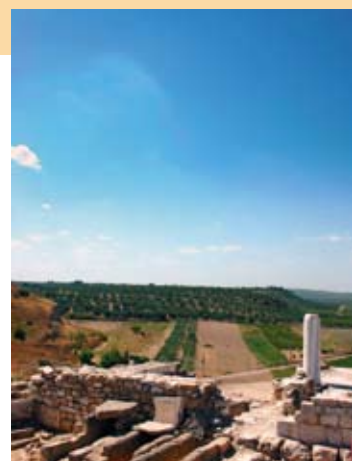
Canne della Battaglia

Fognatura bianca via Boggiano - Approvato il progetto definitivo. In attesa di gara (Importo € 516.000).