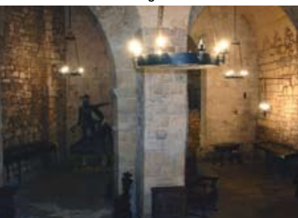
Cantina della Sfida