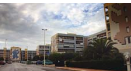
Parco degli Ulivi