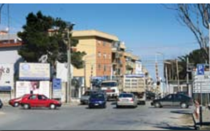
Passaggio a livello di via Andria