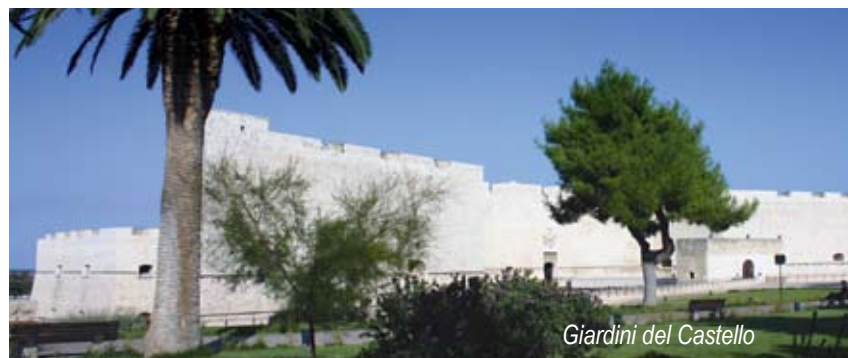
Giardini del Castello

Via Marina e piazza Pescheria - Sta per essere attivata la gara d'appalto per rifacimento marciapiedi e basolato. Importo € 300.000.